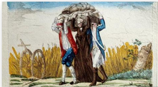
Estampe « Le temps présent veut que chacun supporte le grand fardeau ». Un paysan, un membre du clergé et un soldat portant à trois le poids de la dette nationale, période de la révolution française Caricature de la fin du XVIIIe siècle au musée Carnavalet, à Paris.

La seconde partie, passera en revue certaines expériences historiques auxquelles l'endettement des Etats a mené. En effet on peut identifier, dans l'histoire, des pistes incontournables que les gouvernants d'aujourd'hui seront un jour obligés d'emprunter. Il n'est donc pas inutile de savoir comment l'État Français a, jadis, résolu ses problèmes de déficit et de dette.